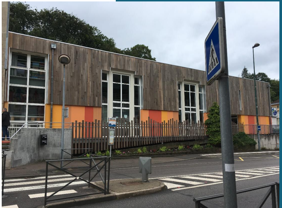
Vue extérieure de l'école maternelle d'Ambraïl à Epinal