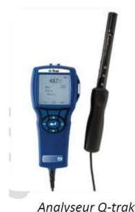
Analyseur Q-Trak pour mesurer les taux de dioxyde de carbone