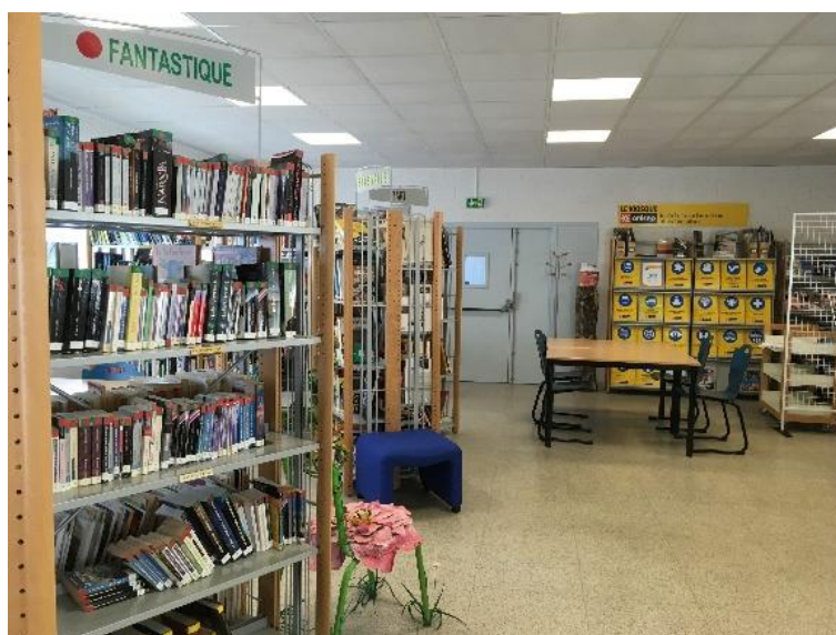
Bibliothèque du lycée Blaise Pascal à Saint-Dizier