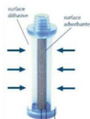
Tubes passifs (système radiello : cartouche + corps diffusif pour les aldéhydes et autres COV