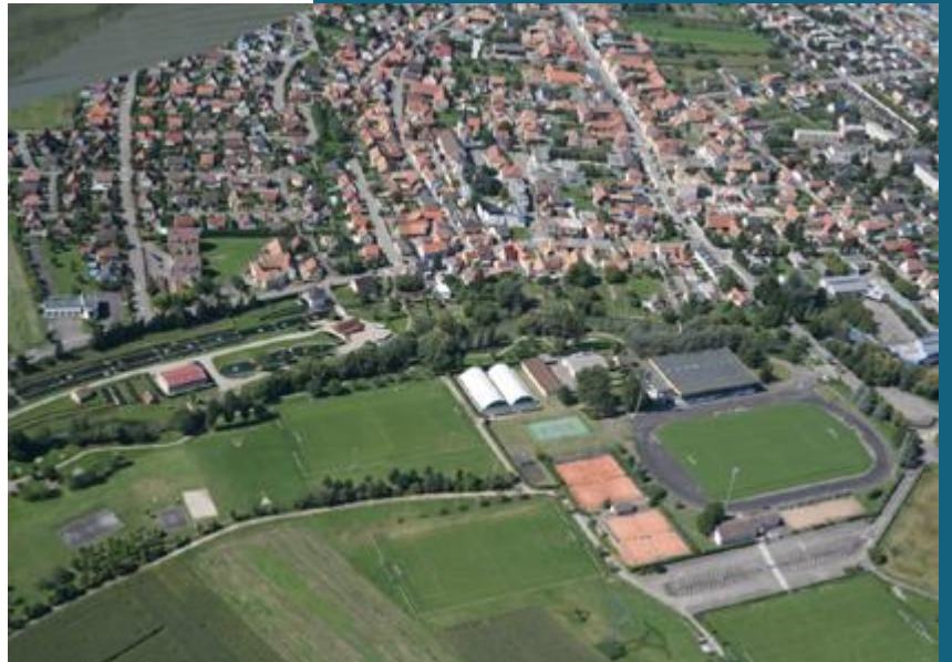
Vue aérienne de Biesheim