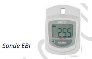
Sonde EBI pour mesurer la température et l'humidité relative

La mesure de dioxyde de carbone est réalisée par spectrométrie d'absorption infrarouge non dispersif. Parallèlement à ces mesures, les paramètres de confort (humidité relative et température) sont également mesurés.