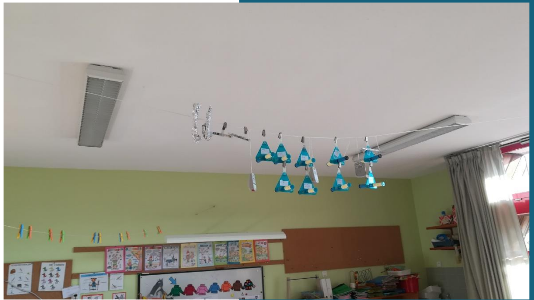
Tubes passifs installés pour prélèvements des polluants mesurés dans l'école maternelle de Oberhausbergen