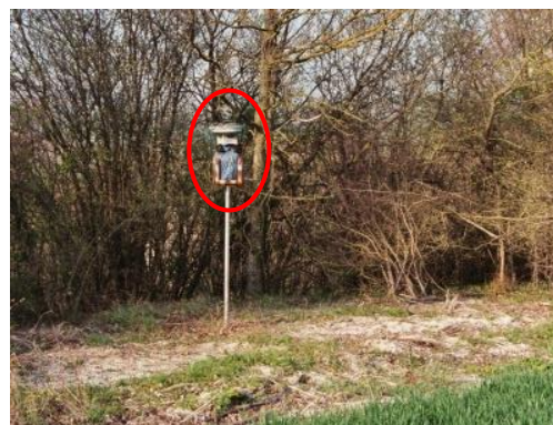
Jauge OWEN sur le site 2 : Côte de la Chaussée

Pour le suivi trimestriel 2019, les prélèvements sont réalisés sur les sites suivants :