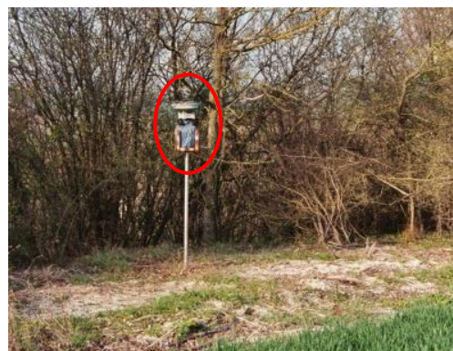
Jauge Owen sur le site 2 : Côte de la Chaussée

Cependant, tous les sites de prélèvements ne sont pas concernés à chaque campagne trimestrielle :