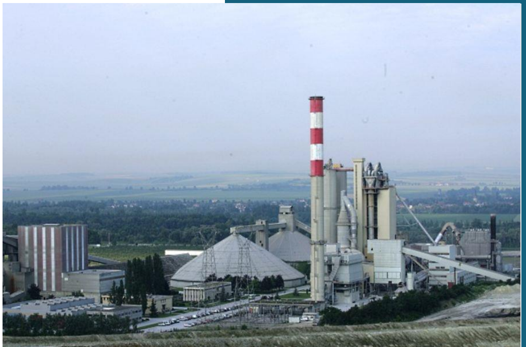
Usine de Couvrot